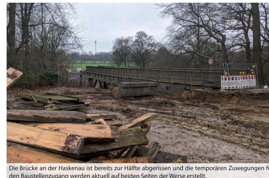
Die Brücke an der Haskenaubrücke ist bereits zur Hälfte abgerissen und die temporären Zuwegungen für den Baustellenzugang werden aktuell auf beiden Seiten der Welse erstellt.