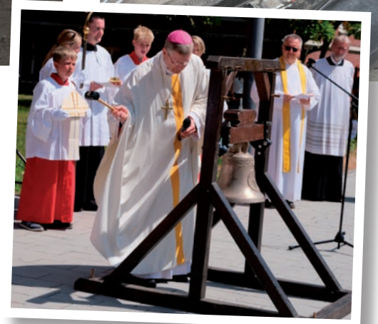
Fotos: o.l. Glockenguss in Gescher, o.r. die Glocke ist an ihrer Krone mit Eisenbändern am Tragbalken, dem so genannten Joch befestigt, u.r. feierliche Einsegnung und Anschlagung der Glocke durch Weihbischof Stefan Zekorn

somit zum Läuten zu bringen. Wir dürfen gespannt sein, welche Ideen in der Zukunft noch entstehen werden; denn eines ist klar: unserer Glocke möge es niemals langweilig werden, sondern sie darf immer zu ihrer eigentlichen Bestimmung nachkommen – nämlich zu läuten.