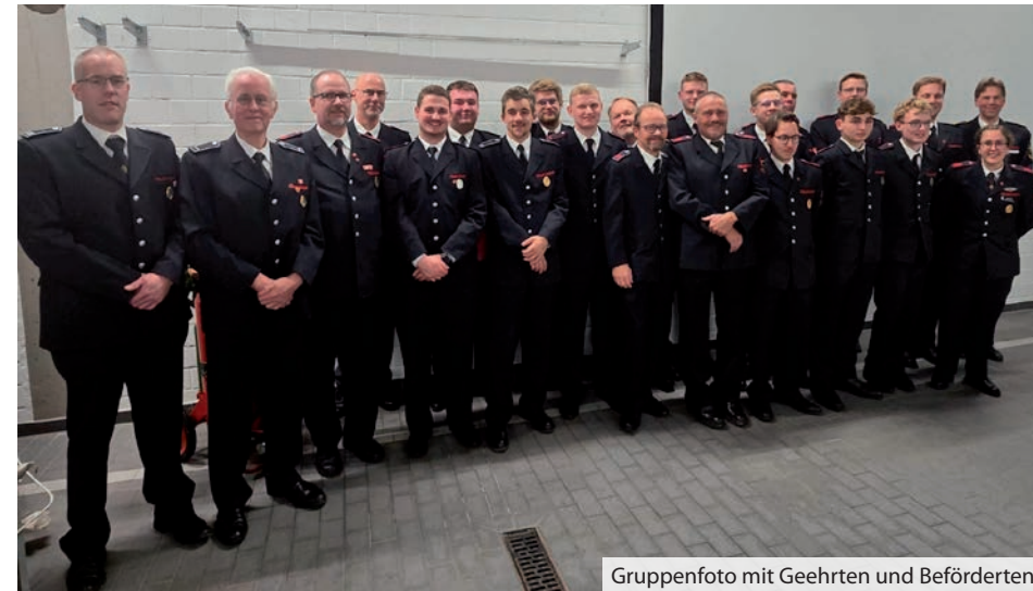
Gruppenfoto mit Geehrten und Beförderten