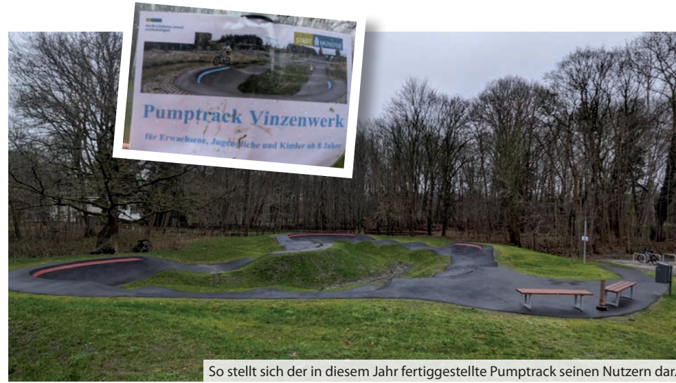
So stellt sich der in diesem Jahr fertiggestellte Pumptrack seinen Nutzern dar.

Ein Pumptrack ist ein geschlossener Rundkurs mit Steilkurven, Wellen und Sprüngen. Ziel des Pumptracks ist es, durch die Gewichtsverlagerung auf dem Rad bzw. durch gezielte Zieh- und Drückbewegungen („Pumping“) Geschwindigkeit aufzubauen, um so den Parcours zu befahren. Der Pumptrack ist dabei eine Herausforderung für jede Alters-