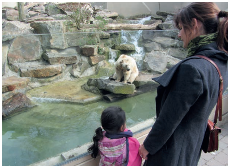
Eine Mitmachpatin mit ihrem Patenkind beim Besuch im Zoo

Ehrenamtliche Mitmachpaten tun was ganz Tolles. Sie schenken Kindern in Münster Zeit. Die Kinder kommen aus Familien, die es nicht so leicht haben – wenig Geld, viele Geschwisterkinder oder Krankheit der Eltern. 70 Mitmachpaten sind in Münster unterwegs. Sie verbringen jede