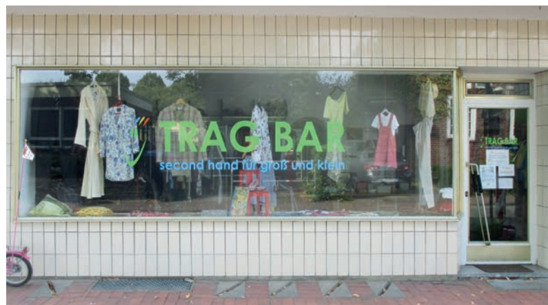
Aus der Kleiderkammer wird „Tragbar second-hand für groß und klein“

Die Kleiderkammer, die vor ca. 2 Jahren, in der Ludwig-Wolker-Straße eingerichtet wurde, hat ihre „Bestimmung“ geändert. Die Flüchtlingshilfe Münster-Ost hat damals das Lokal als Kleiderkammer für die vielen Flüchtlinge eingerichtet und gegen einen kleinen Obolus Kleidung, Schuhe, Bettwäsche, Kinderkleidung usw. verkauft. Diese Sachen wurden von Handorferinnen und Handorfern gespendet. Durch die Auflösung der Flüchtlingseinrichtung in der Lützow-Kaserne sowie die Reduzierung der Flüchtlingsfamilien am Kirschgarten, ist der Bedarf an Kleidung geringer geworden. Das Kleiderkammer-Team hat sich vor einiger Zeit entschieden, die Kleiderkammer in die „tragbar“ umzuwandeln, mit der Bestimmung, dass dort nun jeder einkaufen kann. Es wird kein kommerzieller